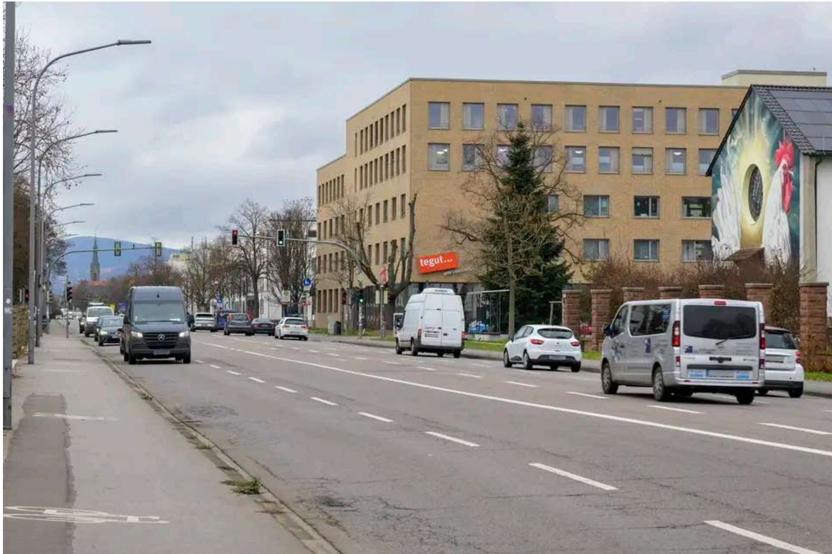
Die Römerstraße in der Heidelberger Südstadt: Nach der Entscheidung des Gemeinderats soll hier künftig auch am Tag Tempo 30 gelten.