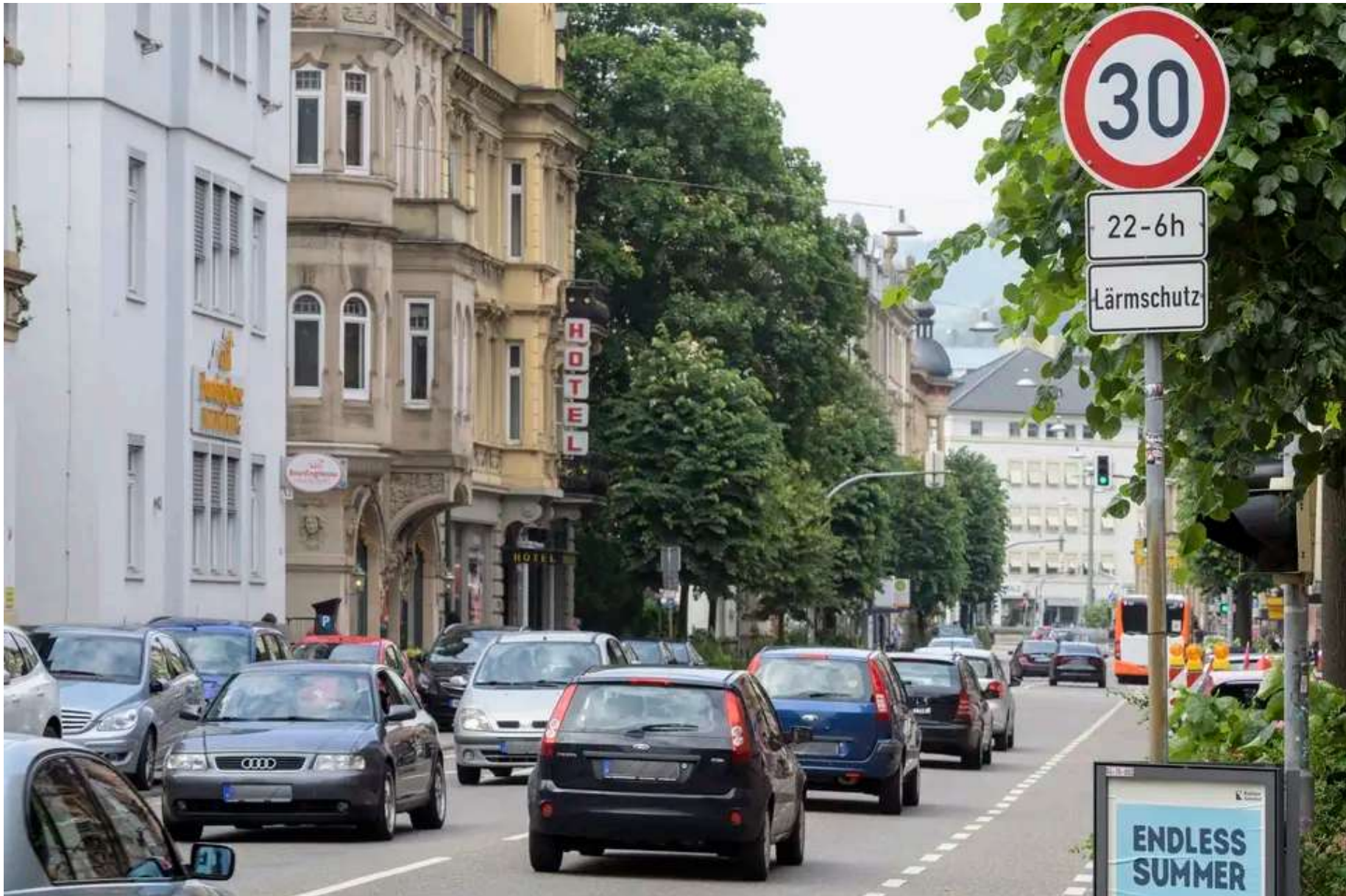
In der Rohrbacher Straße gilt nachts bereits aus Lärmschutzgründen Tempo 30. Diese Maßnahme sieht der städtische Lärmaktionsplan auch für viele weitere Straßen im Stadtgebiet vor. Der Gemeinderat muss ihn jedoch erst beschließen.