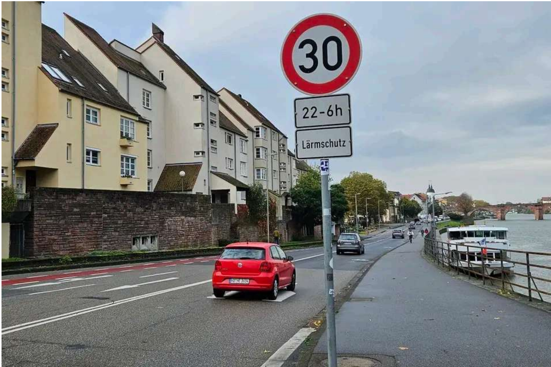
Am Hackteufel gilt bereits Tempo 30 in der Nacht, in vielen weiteren Straßen soll dies nun folgen. Auf dieser Ost-West-Achse, aber auch in Nord-Süd-Richtung, will man tagsüber an Tempo 50 festhalten.