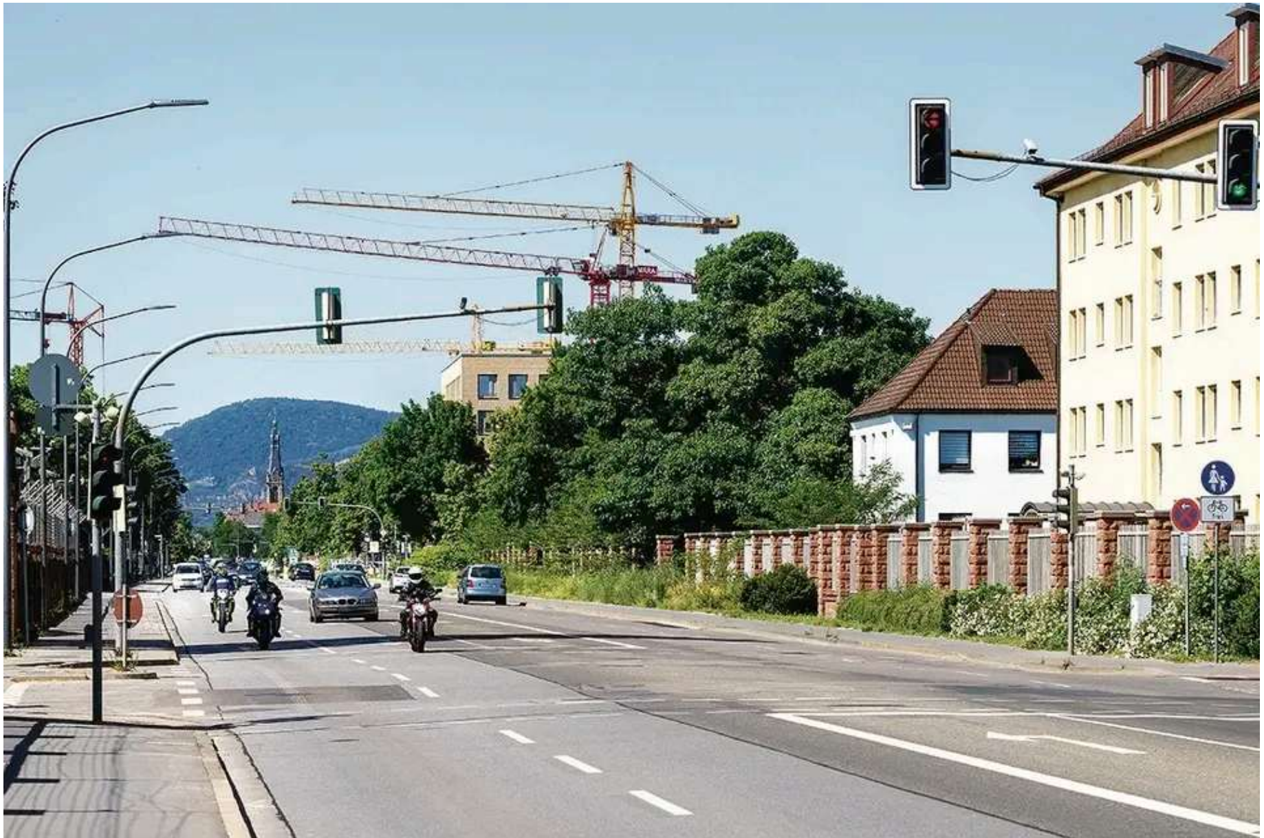
Eine Baumreihe in der Mitte, ein Radweg und der Fußweg hinter der Mauer: Die Römerstraße erhält ein neues Gesicht.